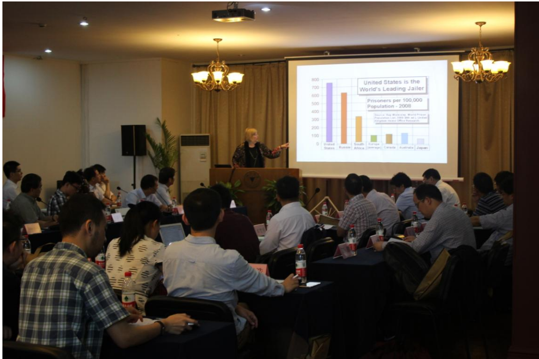
文章和图片由浙江大学提供