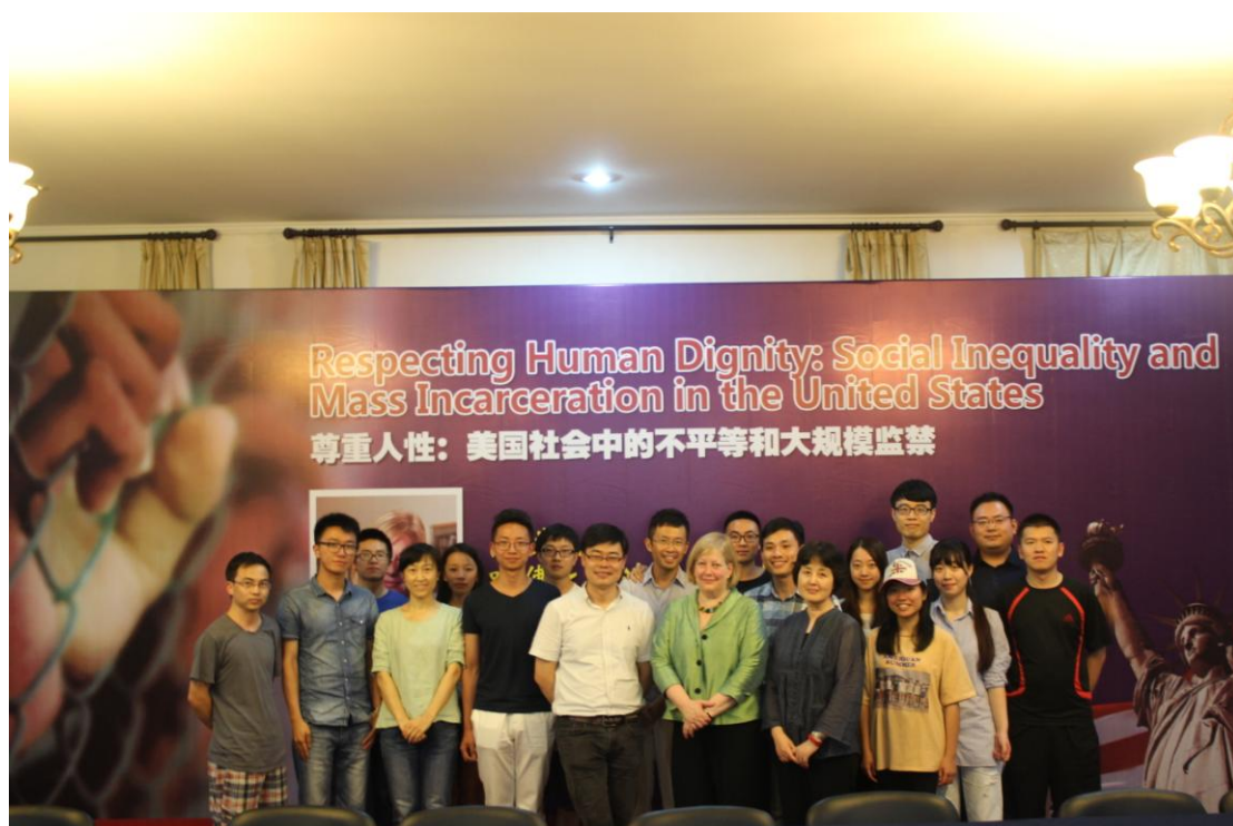
6月25日上午，Steiker 教授在浙江大学之江校区主楼学术报告厅面向研究

Mass Incarceration in the United States”的学术报告，全校数百名师生积极参与，全场热情高涨，座无虚席。Steiker 教授介绍了美国当前司法改革的经验和问题，强调美国目前的刑事改革关注如何在审前程序规制警察的行为，重点是按照联邦宪法第四修正案完善宪法化的侦查制度。针对有组织犯罪、高科技犯罪和恐怖活动，既要实现有效地打击犯罪，也要构建符合时代要求的规制警察行为的机制。在刑事辩护和法律援助方面，我们需要正视宪法第六修正案承诺被告人有权获得辩护的不足之处，法律的最有效的角色可能是通过政治意愿来实现进一步的制度革新。这些对于中国如何深入“以审判为中心”的改革，强化辩护在庭审实质化的作用，以及刑事司法的人性化、文明化等方面都具有借鉴意义。提问环节里同学们踊跃提问，询问美国数月前白人警察枪击黑人嫌疑人的事件、美国监狱中的人权保障情况，以及 Steiker 教授在研究中是如何得到灵感以及如何解决问题的等等，直到观众散场了同学们还是围绕着 Steiker 教授热情交谈。